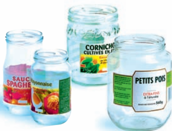
les bocaux de conserve