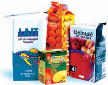
les briques alimentaires