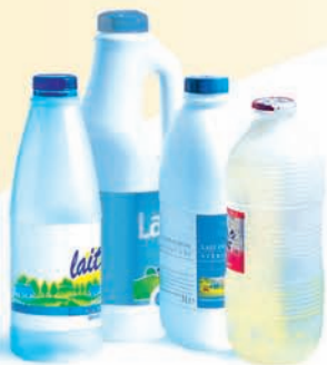
les bouteilles de lait