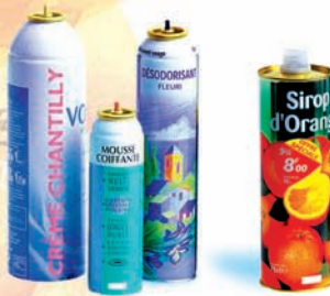
les aérosols et les bidons