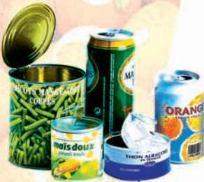
les boîtes de conserve et les canettes