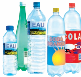
les bouteilles transparentes : eau, jus de fruit, soda...