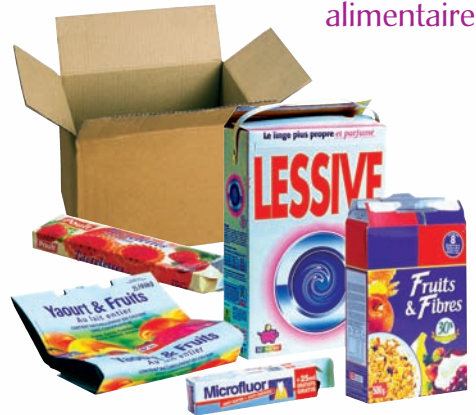
les cartonnettes (boîtes et suremballages) et petits cartons