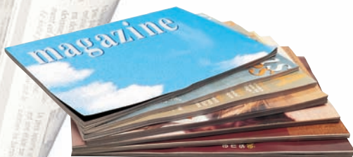
magazines et catalogues