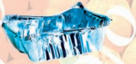
les barquettes en aluminium