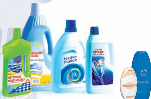
les bouteilles d'adoucissant, de lessive, de liquide lave-vaisselle, de javel, de shampoing...